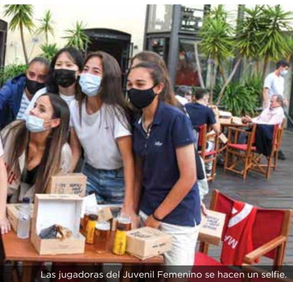
Las jugadoras del Juvenil Femenino se hacen un selfie.