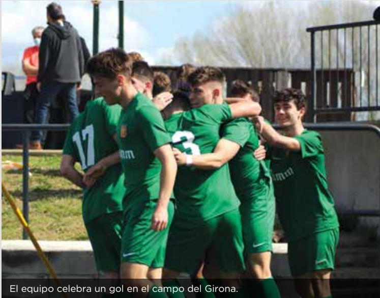
El equipo celebra un gol en el campo del Girona.