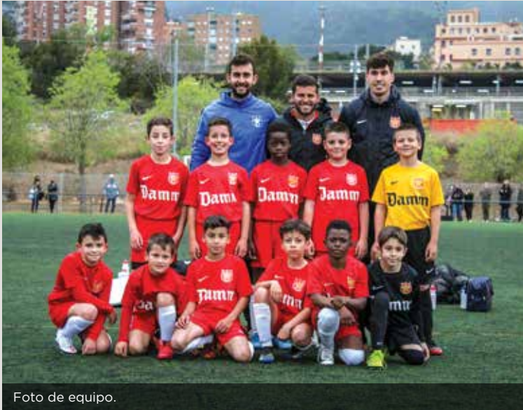
Foto de equipo.

Campo: Vall d'Hebrón - Teixonera C/ Granja Vella, 10-12