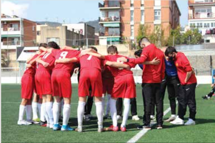
Conjura de los cerveceros antes de iniciar el partido.