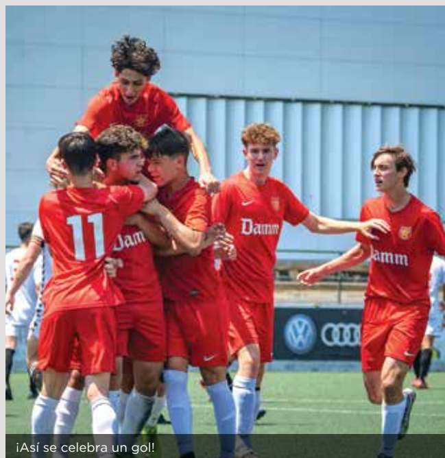
¡Así se celebra un gol!

Una temporada para crecer en una categoría exigente