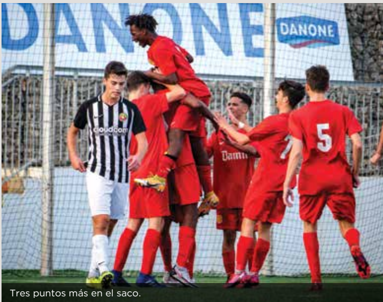
Tres puntos más en el saco.