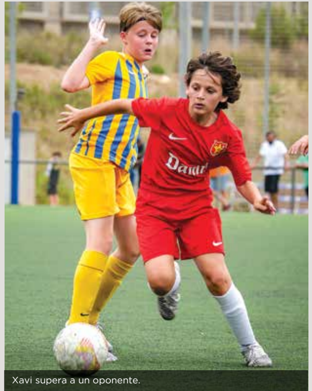
Xavi supera a un oponente.