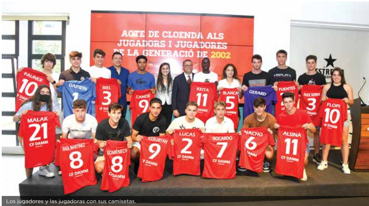
Los jugadores y las jugadoras con sus camisetas.