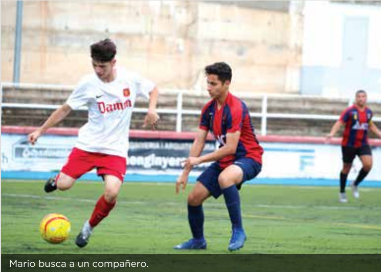
Mario busca a un compañero.