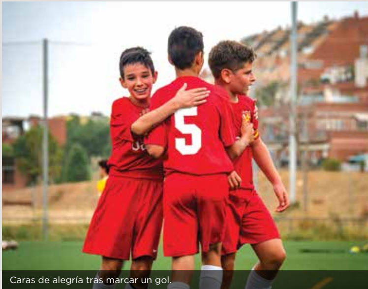
Caras de alegría tras marcar un gol.

Campo: Vall d'Hebrón - Teixonera C/ Granja Vella, 10-12