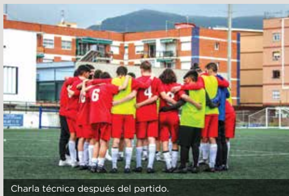
Charla técnica después del partido.