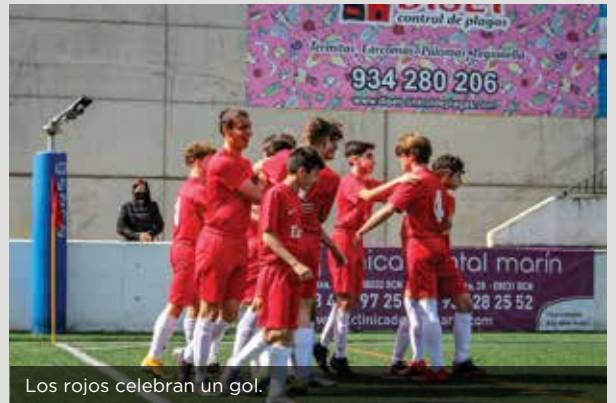
Los rojos celebran un gol.

Satisfechos por el buen trabajo y una meritoria clasificación