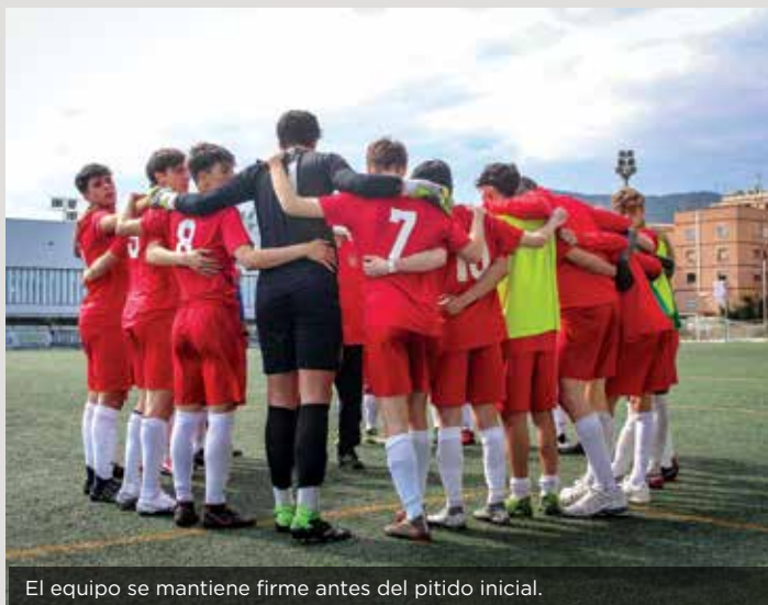
El equipo se mantiene firme antes del pitido inicial.