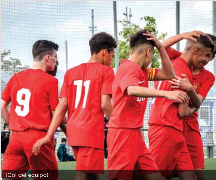
¡Gol del equipo!