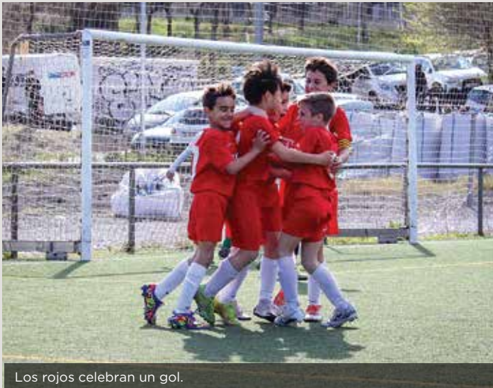
Los rojos celebran un gol.