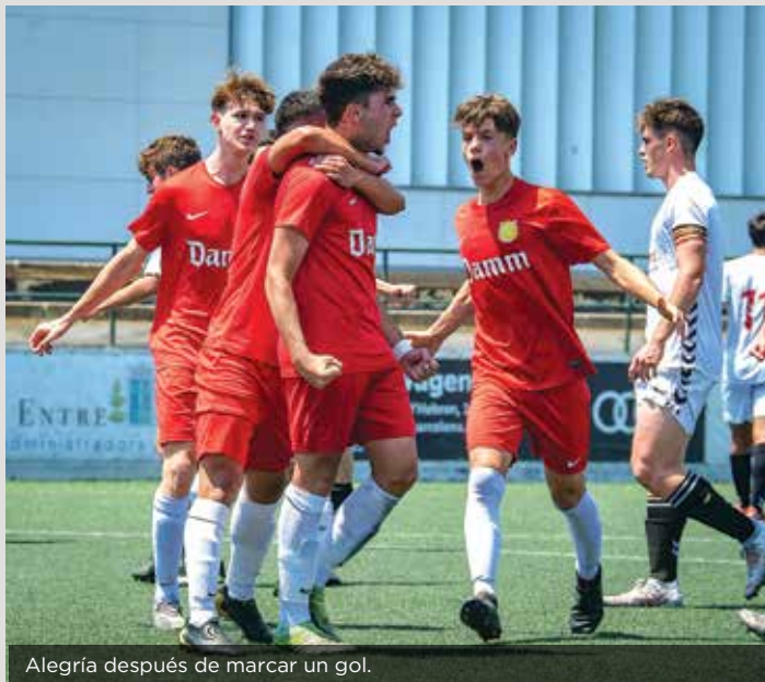
Alegría después de marcar un gol.