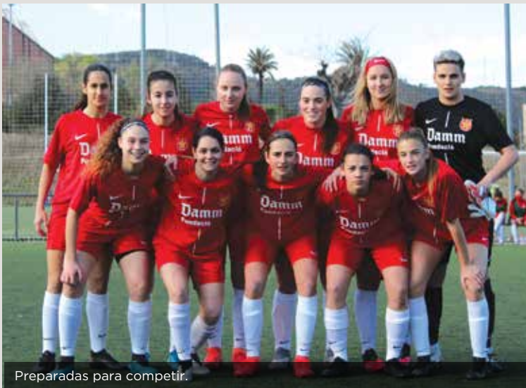
Preparadas para competir.