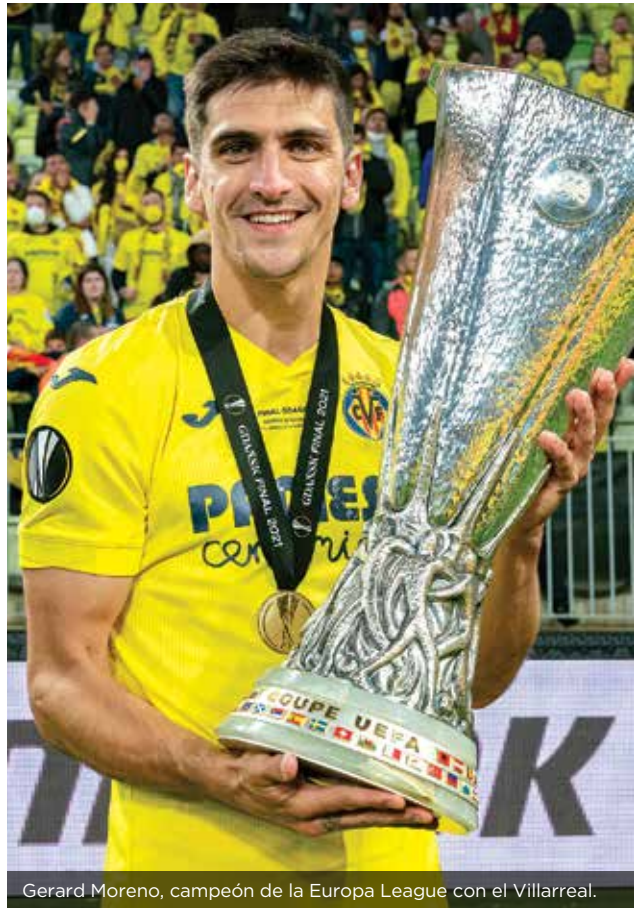
Gerard Moreno, campeón de la Europa League con el Villarreal.

Has ganado el trofeo Zarra dos veces consecutivas (2019/20 y 2020/21) y eres uno de los máximos goleadores de la liga en las últimas temporadas. ¿Cuál es el secreto de tu éxito?