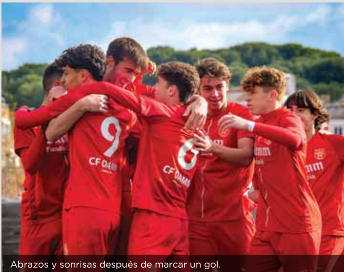
Abrazos y sonrisas después de marcar un gol.