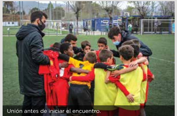
Unión antes de iniciar el encuentro.