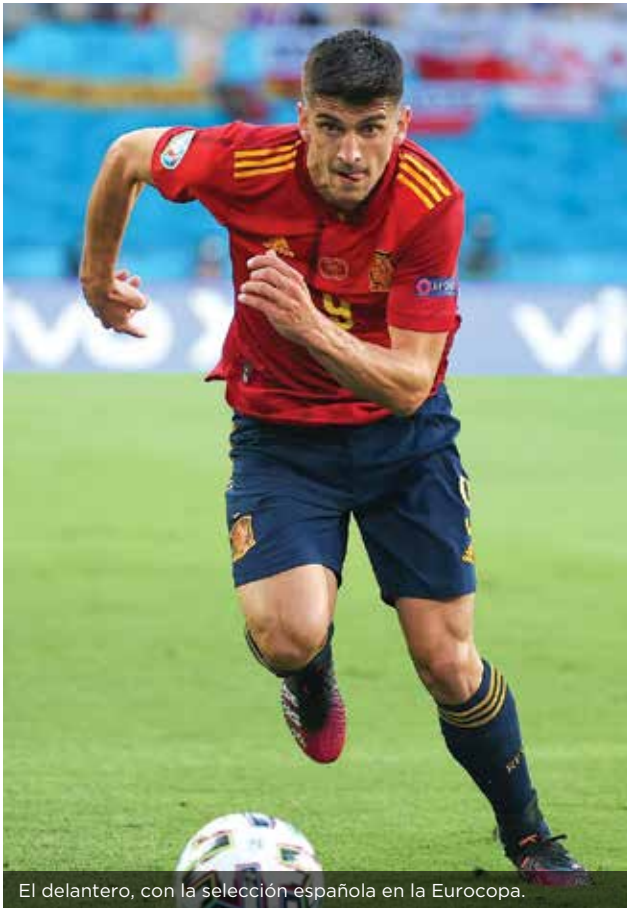
El delantero, con la selección española en la Eurocopa.