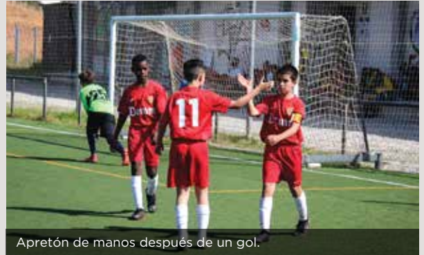
Apretón de manos después de un gol.