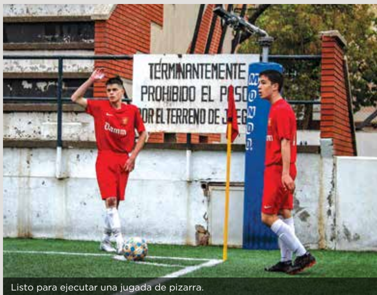
Listo para ejecutar una jugada de pizarra.