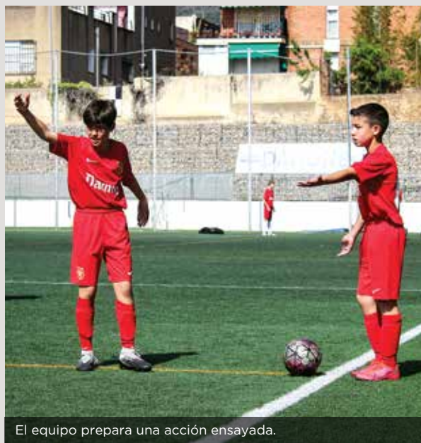
El equipo prepara una acción ensayada.