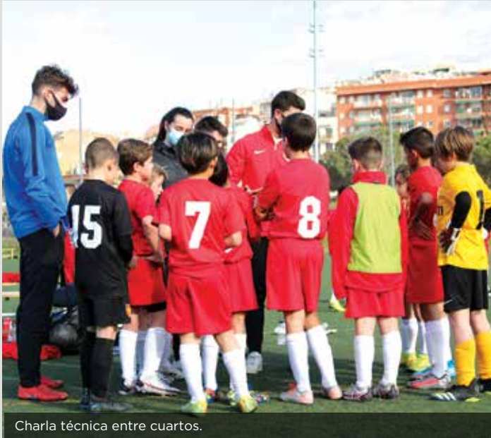
Charla técnica entre cuartos.

Campo: Vall d'Hebrón - Teixonera C/ Granja Vella, 10-12