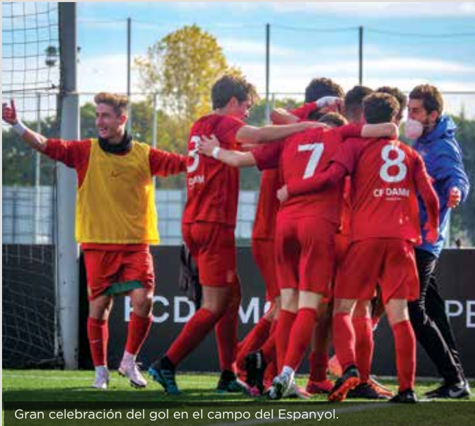
Gran celebración del gol en el campo del Espanyol.