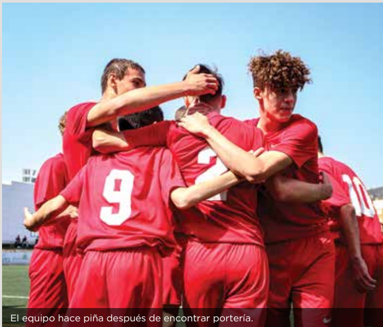
El equipo hace pifa después de encontrar portería.