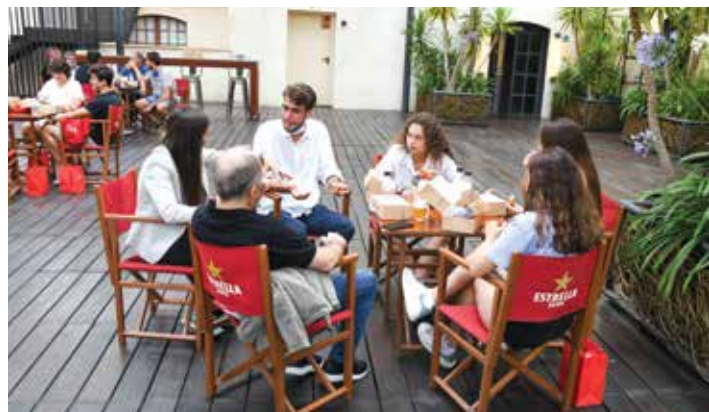
Los integrantes del Juvenil Femenino durante la merienda.