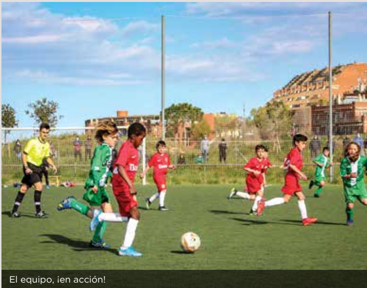
El equipo, en acción!