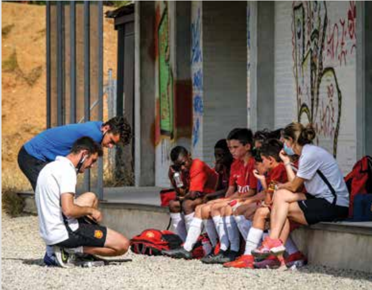
Los jugadores escuchan las indicaciones del cuerpo técnico.

Campo: Vall d'Hebrón - Teixonera C/ Granja Vella, 10-12