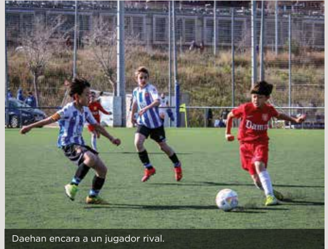
Daehan encara a un jugador rival.