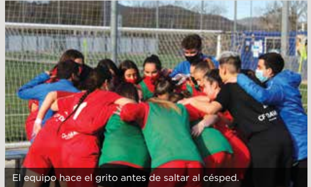
El equipo hace el grito antes de saltar al césped.