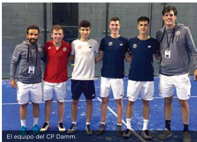
El equipo del CP Damm.