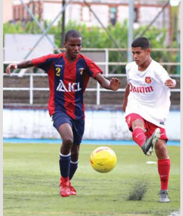
Darling, con un gesto magistral.