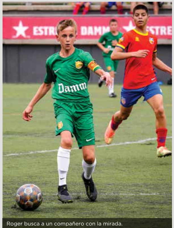
Roger busca a un compañero con la mirada.