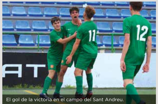
El gol de la victoria en el campo del Sant Andreu.

Segunda posición como recompensa a una gran temporada