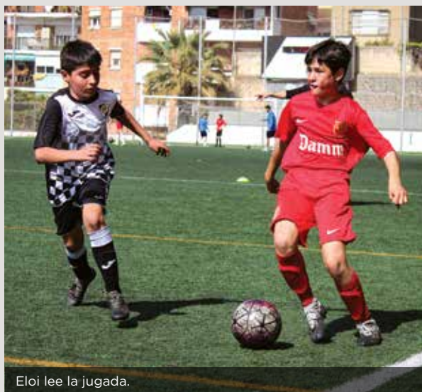
Eloi lee la jugada.