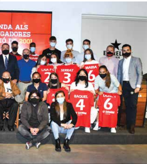
Foto de familia con los ex cervceros.