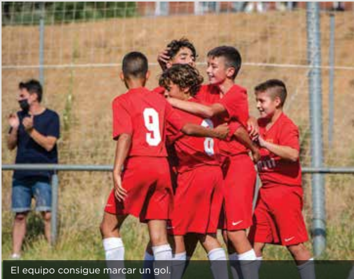
El equipo consigue marcar un gol.